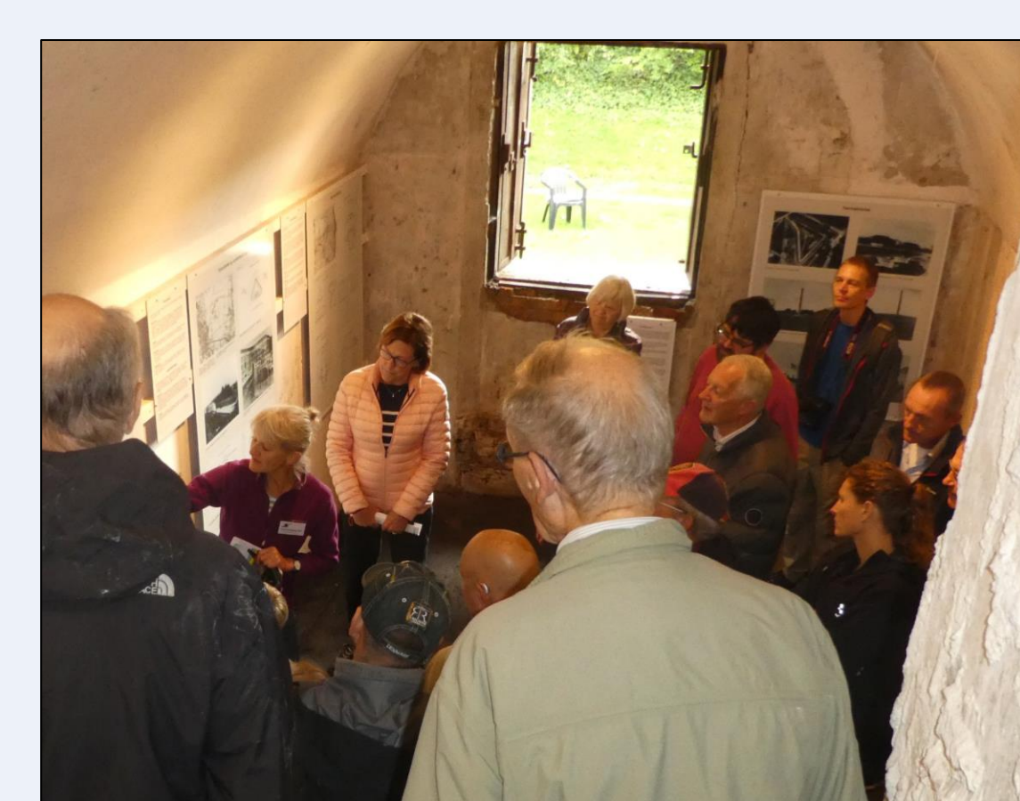
Rundvisning i Fortunfortet på Befæstningsdagen