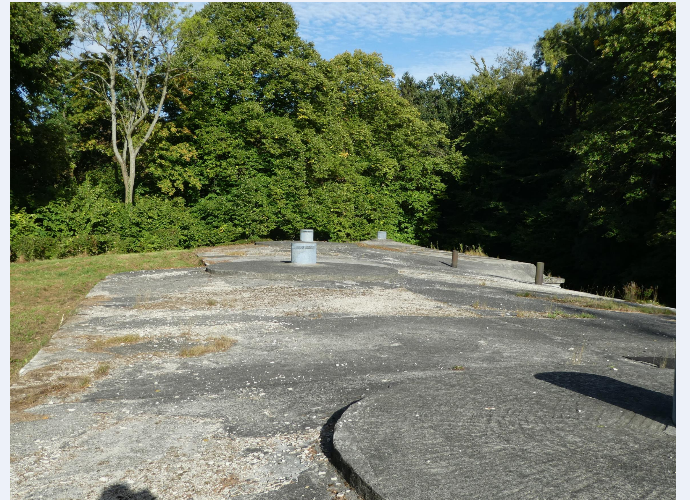
Det ødelagte og utætte betontag