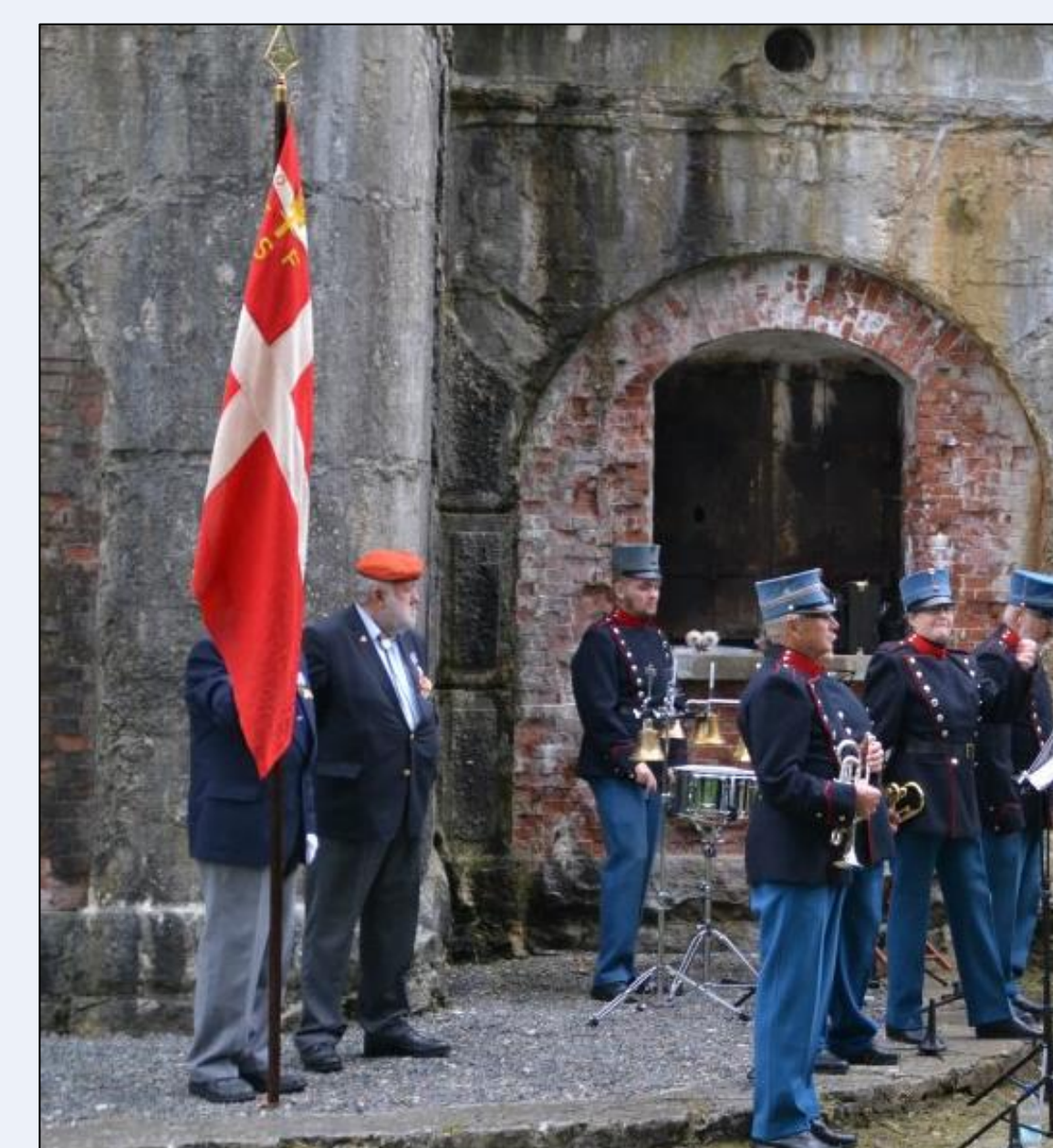
Markering af slaget på Isted Hede den 25. juli 1850 .