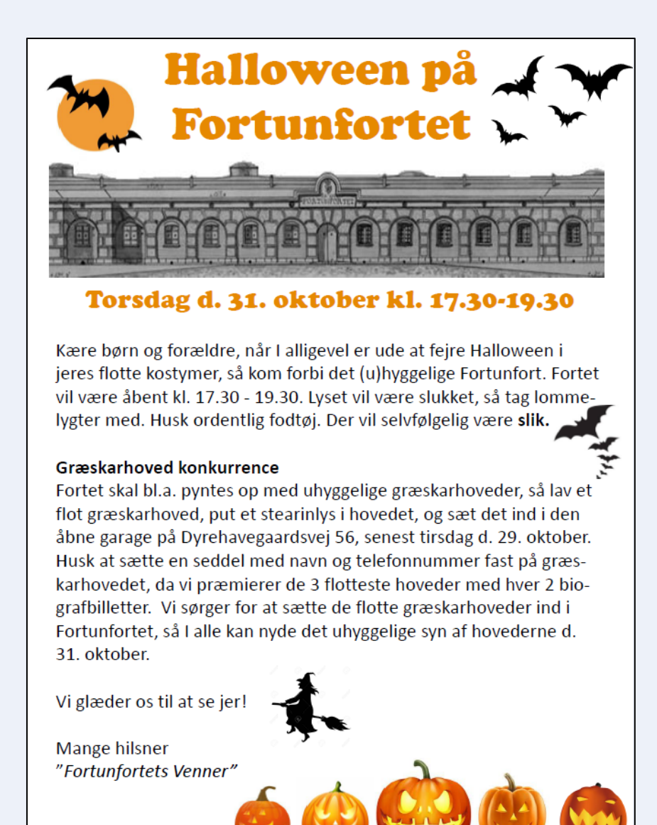
Halloween på Fortunfortet